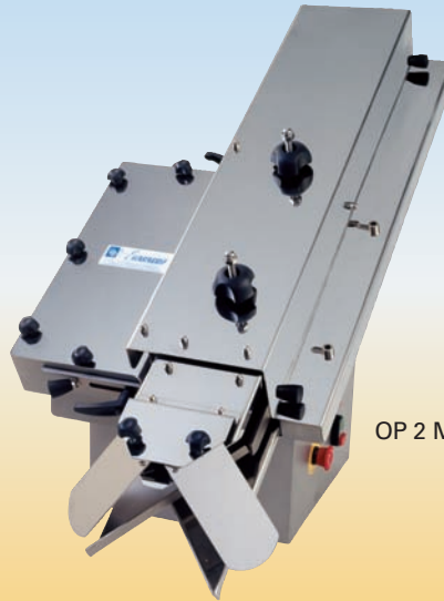
OP 2 MINI